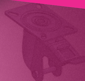
Trava modelo 3 Brake type 3 Freno modelo 3

Código Industrial ***** 05577 ***** 05578 ***** ***** ***** ***** 03467