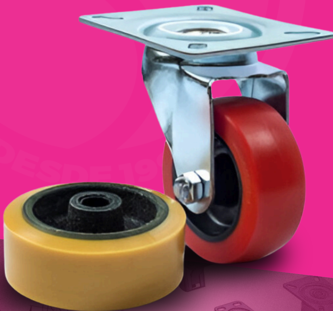
Trava modelo 1 Brake type 1 Freno modelo 1